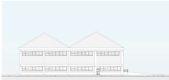
Almacenes Generales Este 1:200