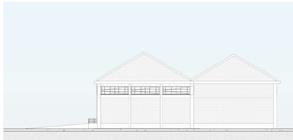
Almacenes Generales Oeste 1:200