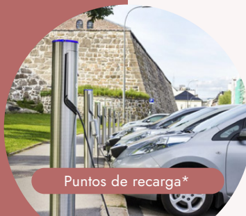
Puntos de recarga*

A través de la certificación VERDE para nuestros parques empresariales (VERDE DU Polígonos) y edificios (VERDE Edificios), caminamos hacia una versión más responsable y sostenible de nuestro modelo de edificación y urbanismo.