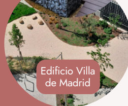
Edificio Villa de Madrid